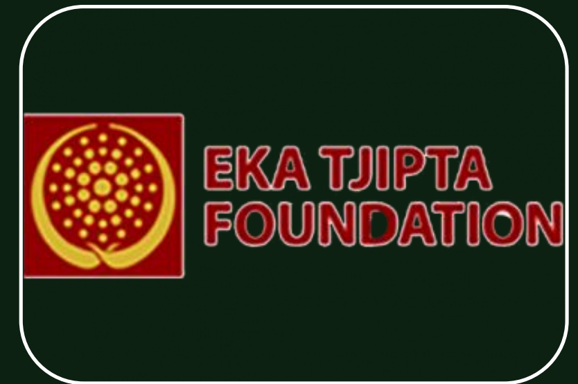
Yayasan Eka Tjipta