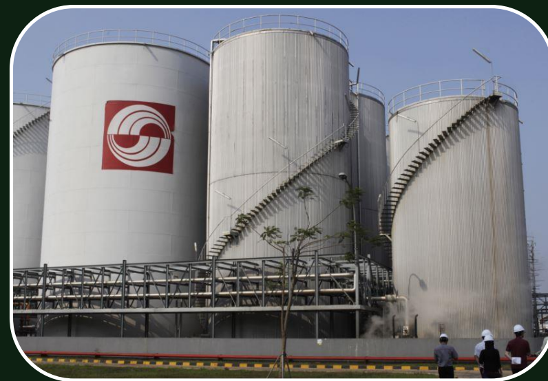
PT. Sinar Mas Grup