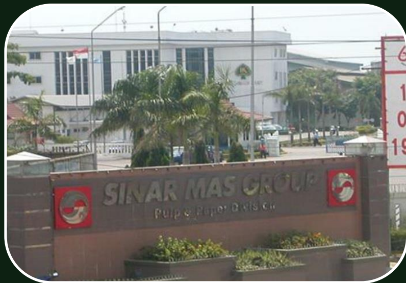
PT. Tjiwi Kimia