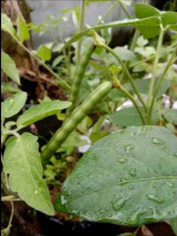
Media tanam Tanah + sekam padi