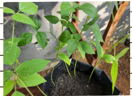
Kacang 130 D