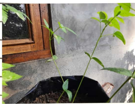
Kacang 130 C