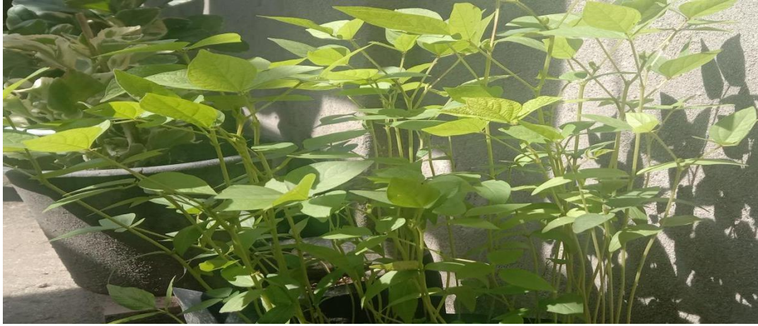
Tanaman kacang hijau media pupuk kandang