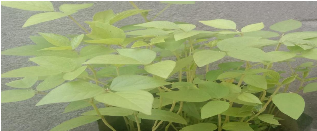
Tanaman kacang hijau media sekam padi