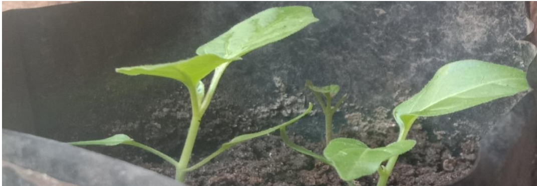
Tanaman cabai media pupuk kandang