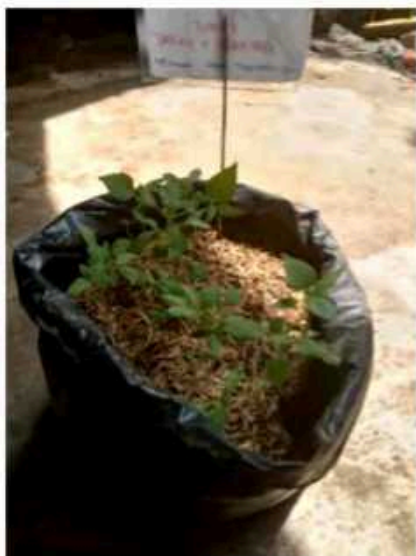
Media tanam 1