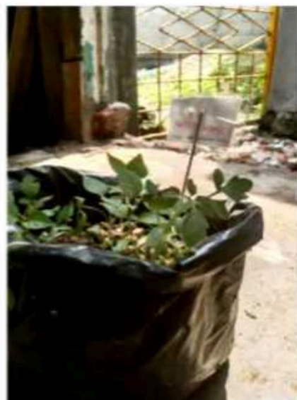
Media tanam 2