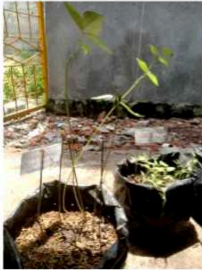
Media tanam 1