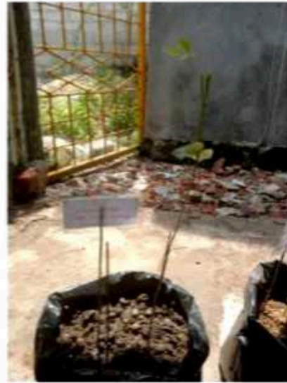
Media tanam 2