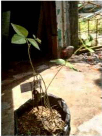
Media tanam 1