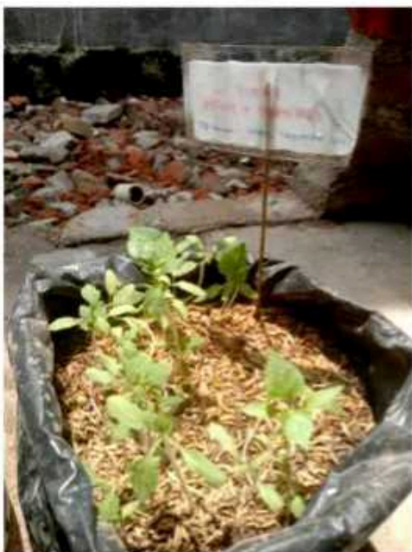
Media tanam 1