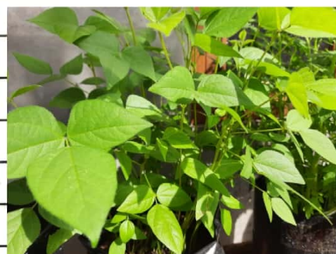
Kacang liso D