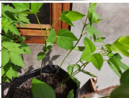
Kacang liso C