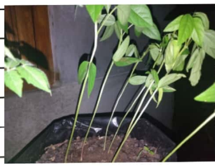
Kacang lijo C