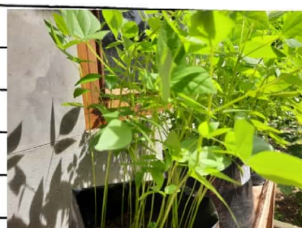
kacang ijo D

A Champion is someone who gets up even when they can't