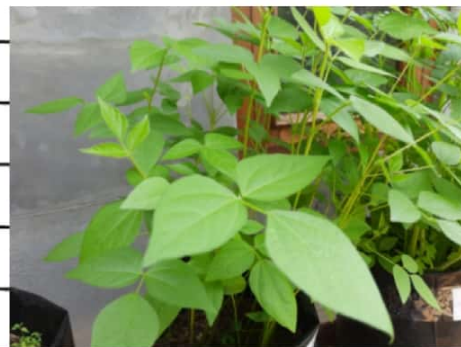
kacang 150 B

To be a winner, all you need is to give all you have