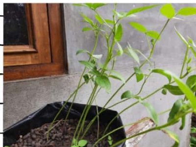
Kacang 150 C