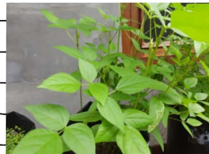
Kacang 150 B