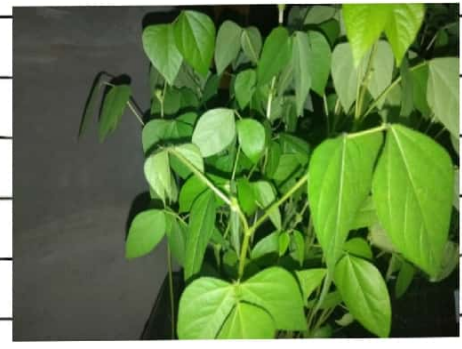
Kacang lijo D

People become fools when they stop asking questions