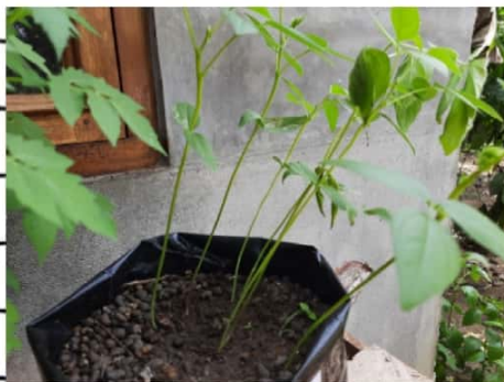
kacang 150 C