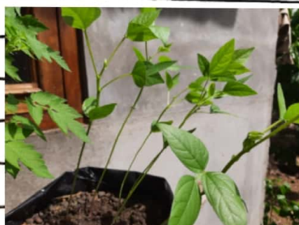
kacang ijo C