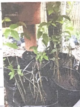
Tanaman kacang hijau media tanam pupuk kandang dan sekam