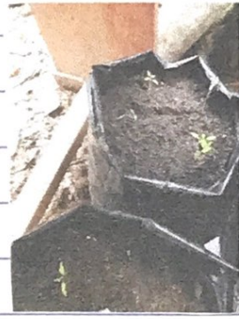
Tanaman Tomat media tanam pupuk kandang