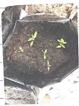
Tanaman Tomat media tanam sekam.