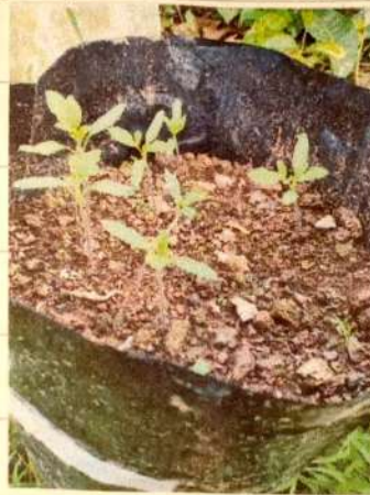
15-17 September 2021