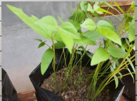
Kacang iso B