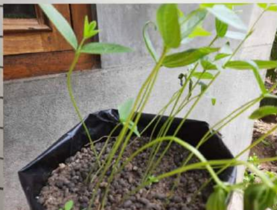
Kacang iso C