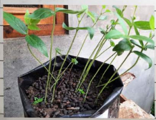
Kacang 130 C