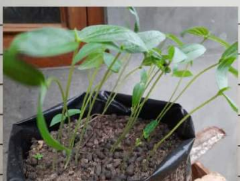
Kacang ijo C