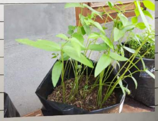
Kacang ISO D