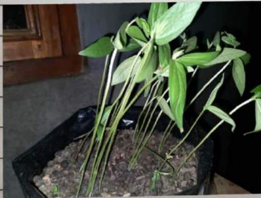
Kacang 150 C