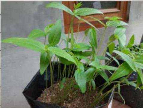
Kacang ijo D