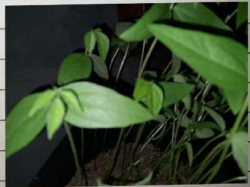
Kacang 150 D