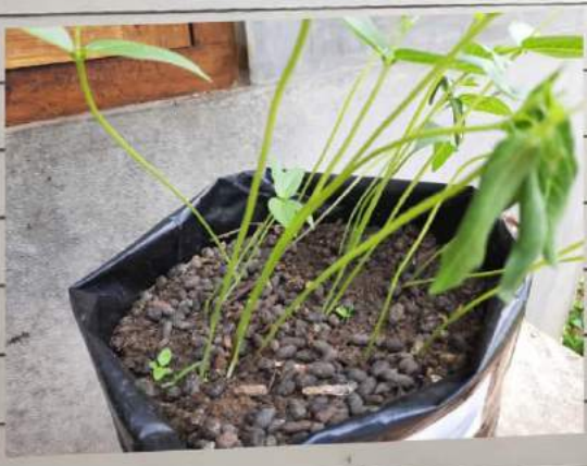
Kacang ISO C