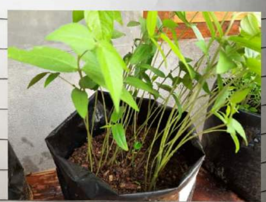
Kacang 130 B