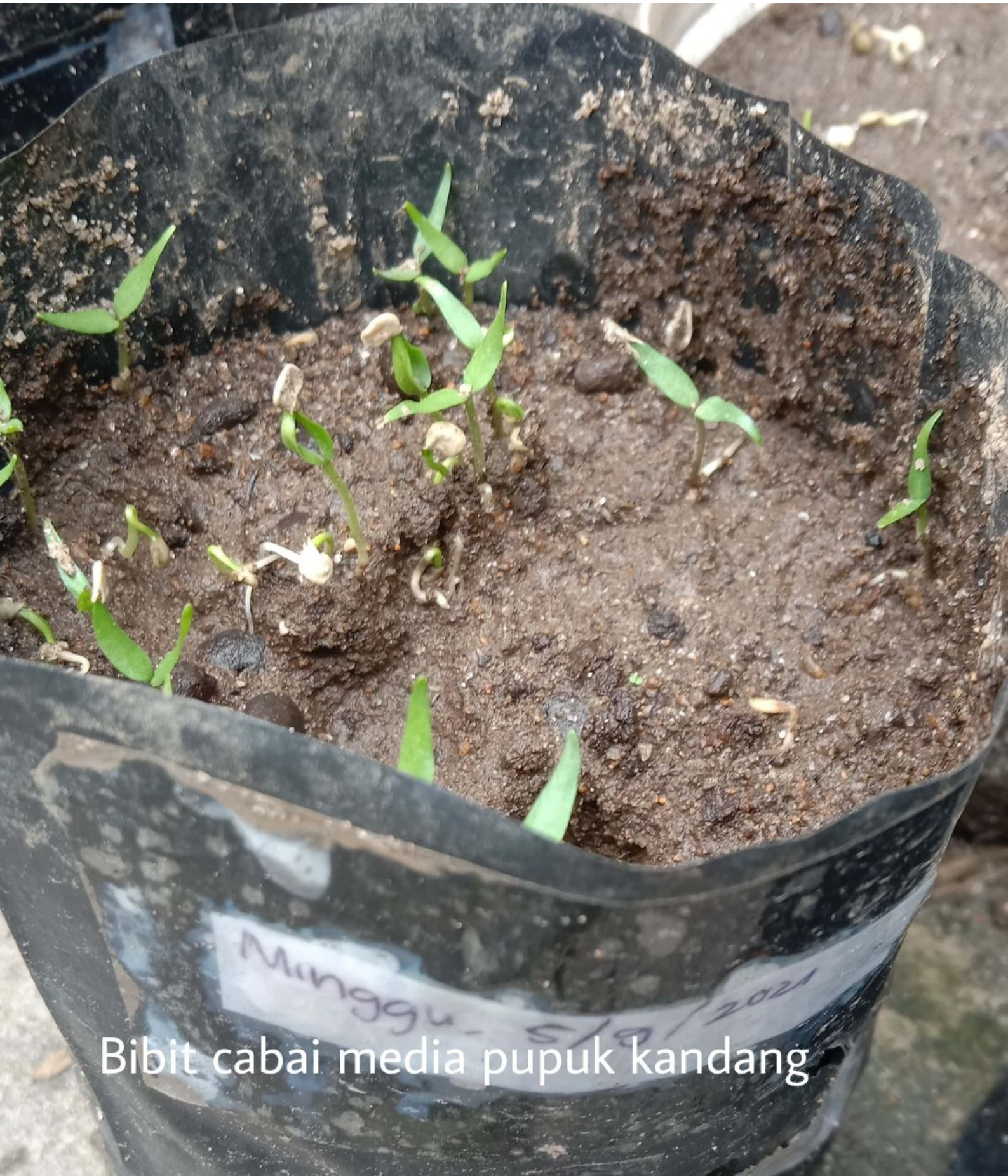
Bibit cabai media pupuk kandang