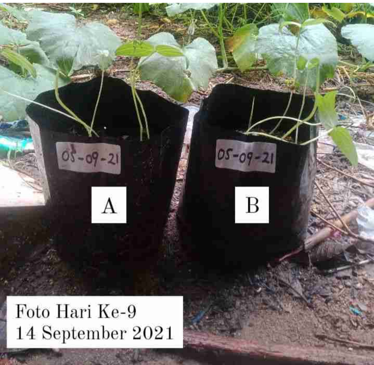
Foto Hari Ke-9 14 September 2021