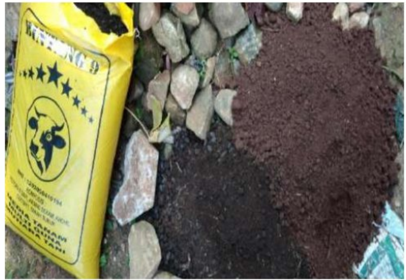
Alat dan Bahan