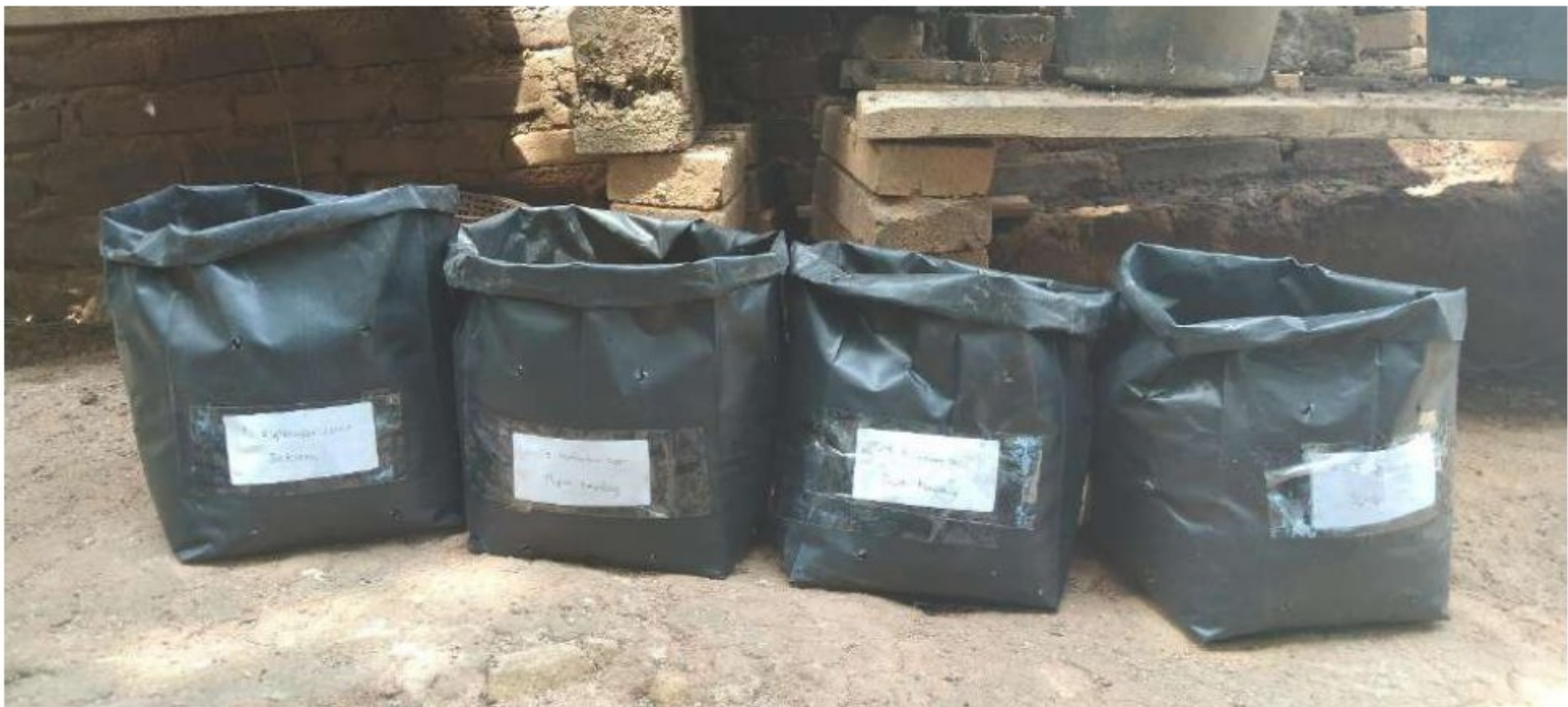
Hari pertama Tanggal 3 September 2021