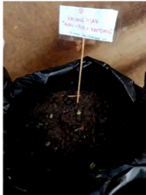
Media tanam 2