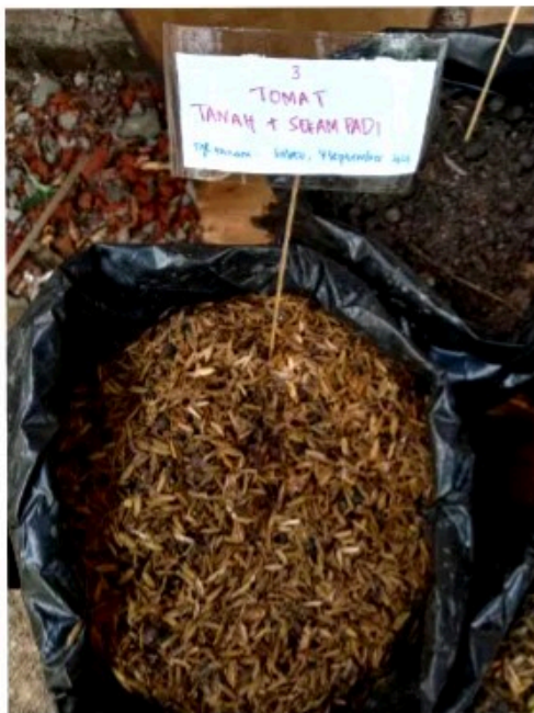
Media tanam 1