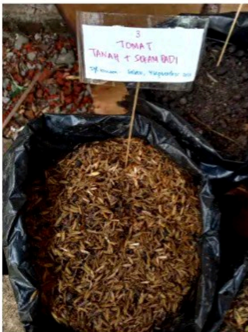
Media tanam 1