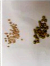
Benih Kacang hijau Dan Tomat