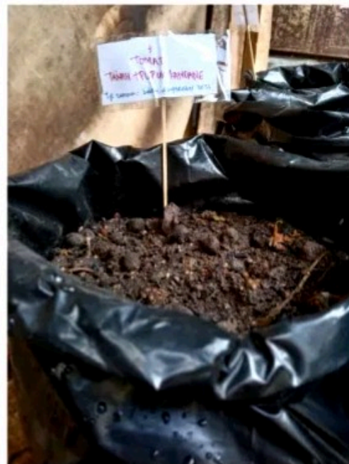
Media tanam 2