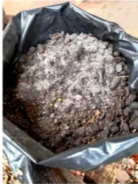
Media tanam 2