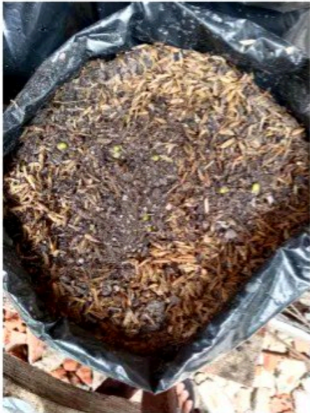
Media tanam 1