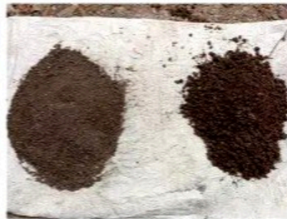
Media tanam 2 (Tanah + pupuk kandang)