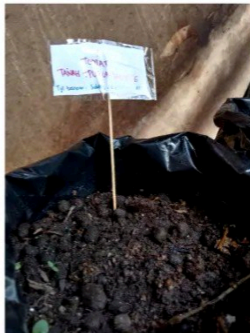
Media tanam 2