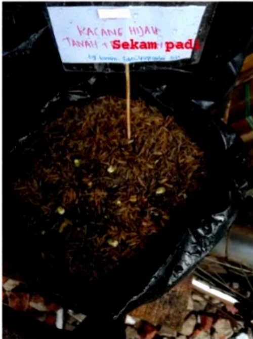
Media tanam 1