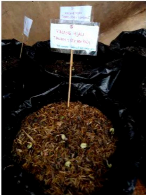
Media tanam 1