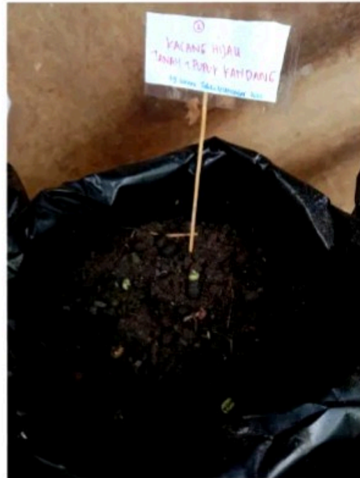
Media tanam 2