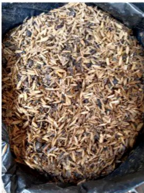
Media tanam 1