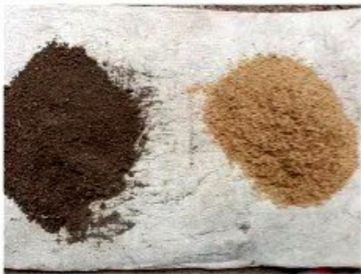
Media tanam 1 (Tanah + sekam padi)