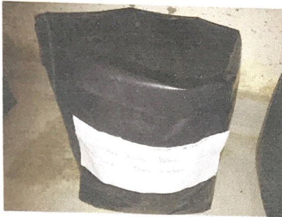
1. Tanaman Kacang Hujau : Pupuk Kandang