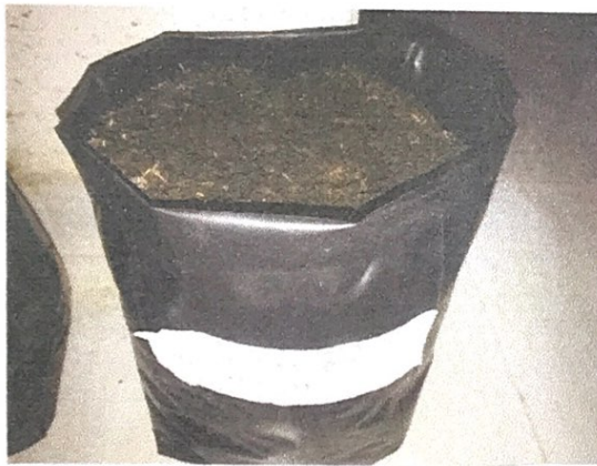
2. Tanaman Kacang Hijau: Sekam