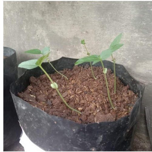
06 September 2021 pengamatan pada tanaman kacang hijau dengan media tanah dan pupuk kandang serta media tanah dan sekam