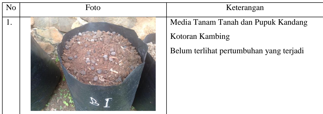
Tabel 1 pengamatan pertumbuhan tanaman jagung

Praktikum ini bertujuan untuk mengetahui pertumbuhan 2 jenis tanaman dengan 2 jenis media tanaman yang berbeda. Alat dan bahan yang digunakan dalam praktikum ini yaitu polybag ukuran 2-3 kg, penggaris, alat tulis. Sedangkan bahan yang digunakan yaitu benih jagung, benih cabai, pupuk kandang (kotoran kambing dan ayam), dan tanah. Penanaman dilakukan pada hari minggu 29 Agustus 2021 yang belokasikan di desa Gunungsari, Ulubelu, Tanggamus.