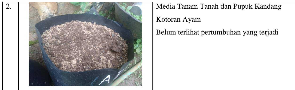
Tabel 2. Pengamatan Pertumbuhan Tanaman Cabai