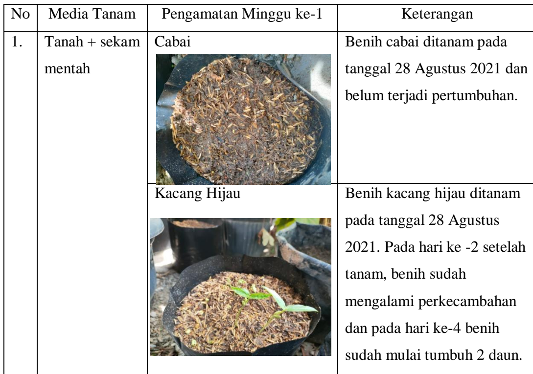
Tabel 1. Pengamatan Pertumbuhan Tanaman Cabai dan Kacang Hijau

Praktikum ini bertujuan untuk mempelajari pertumbuhan yang terjadi pada tanaman kacang hijau dan cabai. Alat yang digunakan pada praktikum ini adalah polybag, penggaris, dan alat tulis. Sedangkan bahan yang digunakan adalah benih tanaman kacang hijau dan cabai masing-masing 5 butir benih tiap polybag, tanah, sekam, dan pupuk kandang (kotoran kambing). Penanaman dilakukan pada Sabtu, 28 Agustus 2021 yang berlokasi di Tulang Bawang Barat.