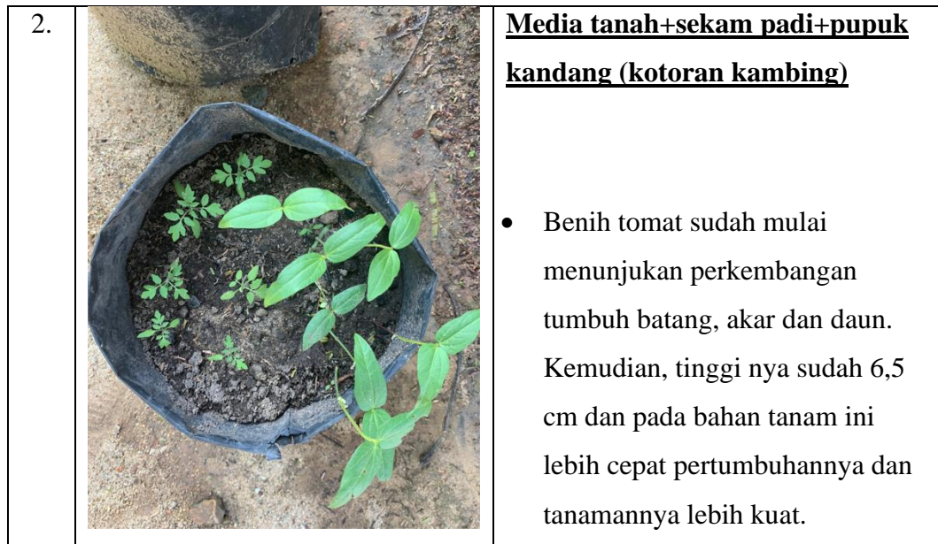
Tabel 2. Pengamatan Pertumbuhan Tanaman Kacang Hijau