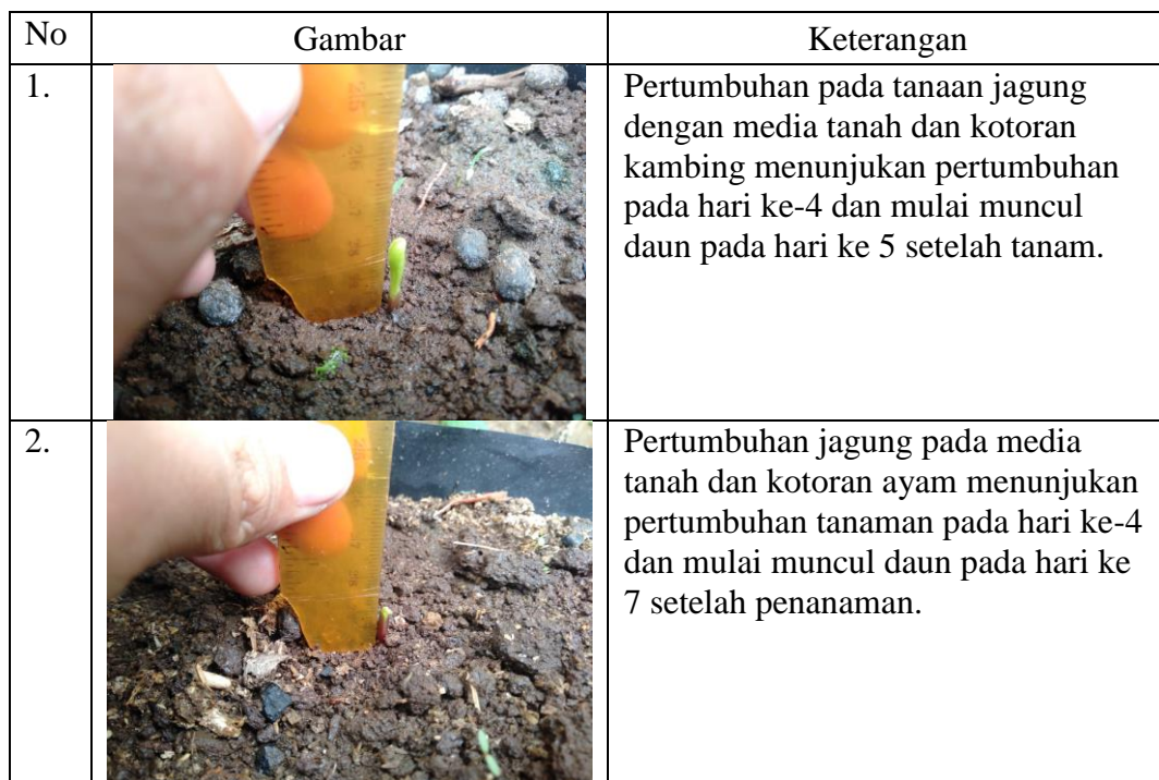
Tabel 1. Pengamatan Pertumbuhan Jagung

Tambahan: tanaman jagung dilakukan penanaman ulang pada hari selasa 7 september 2021. Dan telah menunjukkan pertumbuhan setelah 4 hari penanaman.