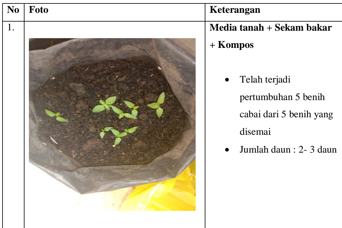
Tabel I. Pengamatan Pertumbuhan Tanaman Cabai

Praktikum ini bertujuan untuk mempelajari pertumbuhan yang terjadi pada tanaman. Alat yang digunakan pada praktikum ini adalah polybag, penggaris, buku catatan, dan kamera untuk mengambil gambar tanaman, sedangkan bahan yang digunakan adalah benih tanaman cabai dan tanaman kacang hijau masing masing 5 butir benih, tanah, sekam, sekam bakar, dan kompos. Penanaman dilakukan pada sabtu, 28 agustus 2021 yang berlokasi di Hajimena.