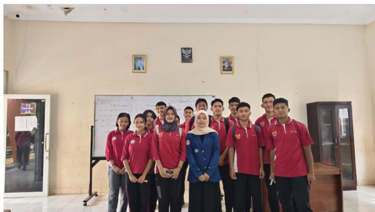
(Dokumentasi di SMA Negeri Olahraga Lampung)