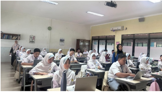
Gambar 1.1 Foto Bersama Siswa/i Kelas XI. 8 SMA AlKautsar Bandar Lampung