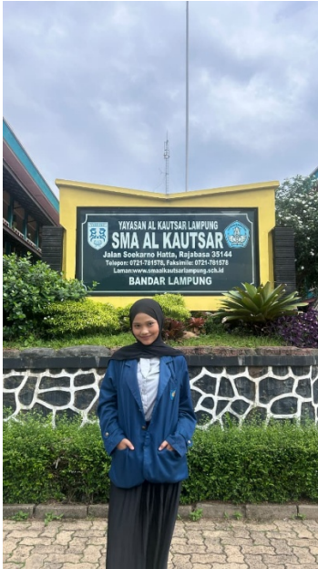
Gambar 1.4 Foto di Depan SMA Al-Kautsar Bandar Lampung