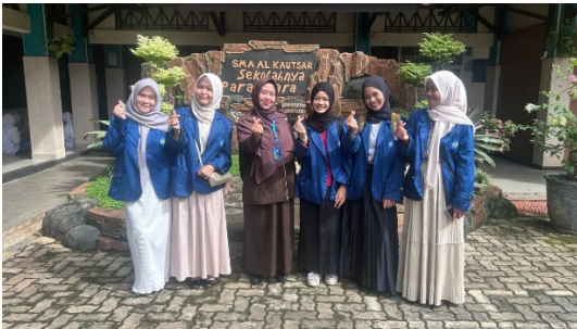
Gambar 1.2 Foto Bersama Guru Ekonomi SMA AlKautsar Bandar Lampung