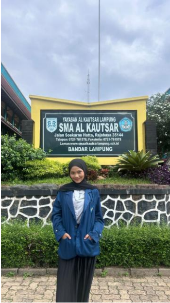
Gambar 1.4 Foto di Depan SMA Al-Kautsar Bandar Lampung