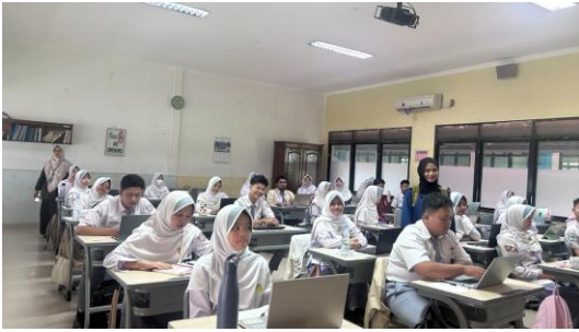
Gambar 1.1 Foto Bersama Siswa/i Kelas XI. 8 SMA AlKautsar Bandar Lampung