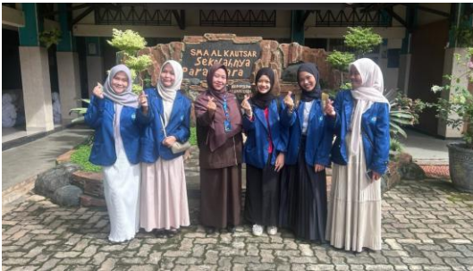
Gambar 1.2 Foto Bersama Guru Ekonomi SMA AlKautsar Bandar Lampung