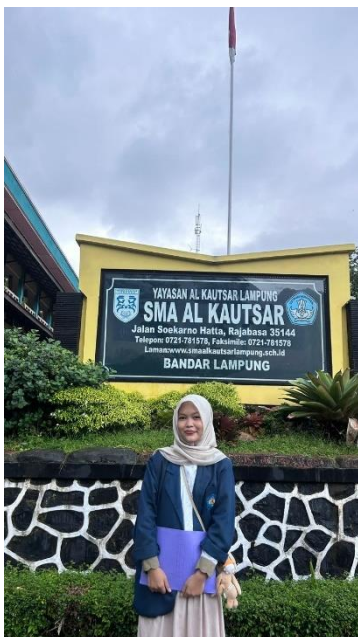
Gambar 1.4 Foto di Depan SMA Al-Kautsar Bandar Lampung