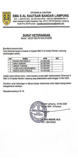
Gambar 1.5 Foto Surat Balasan Dari SMA Al-Kautsar Bandar Lampung