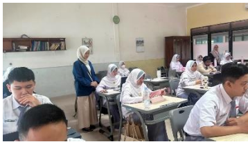
Gambar 1.1 Foto Bersama Siswa/i Kelas X.7 SMA Al-Kautsar Bandar Lampung