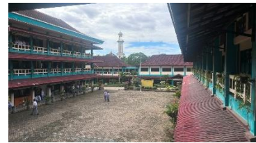
Gambar 1.3 Foto Lingkungan SMA Al-Kautsar Bandar Lampung