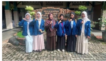
Gambar 1.2 Foto Bersama Guru Ekonomi SMA Al-Kautsar Bandar Lampung