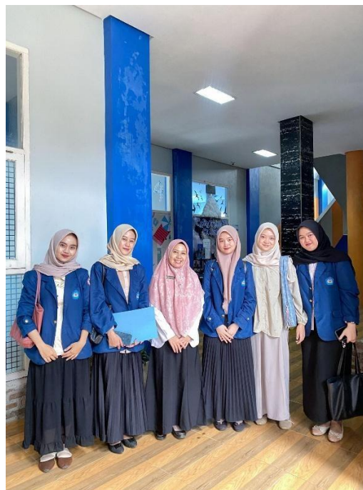
Lampiran 6: Foto Bersama