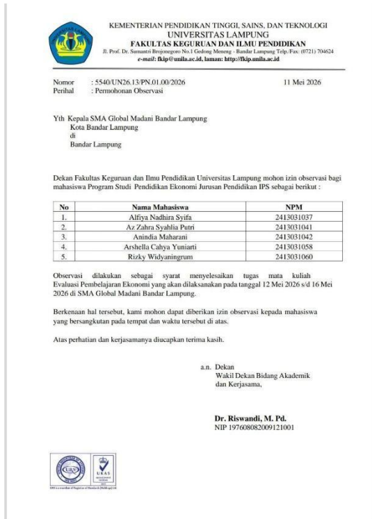
Lampiran 4: Surat Izin Observasi