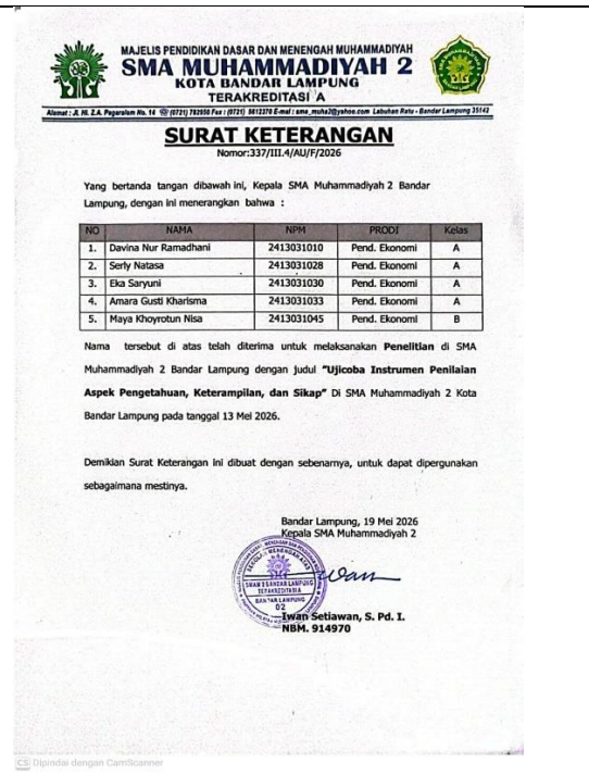
Surat Balasan Sekolah