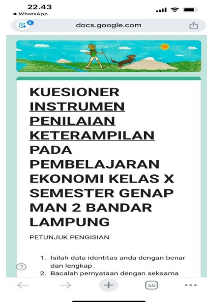
Lampiran 2: Aspek Keterampilan