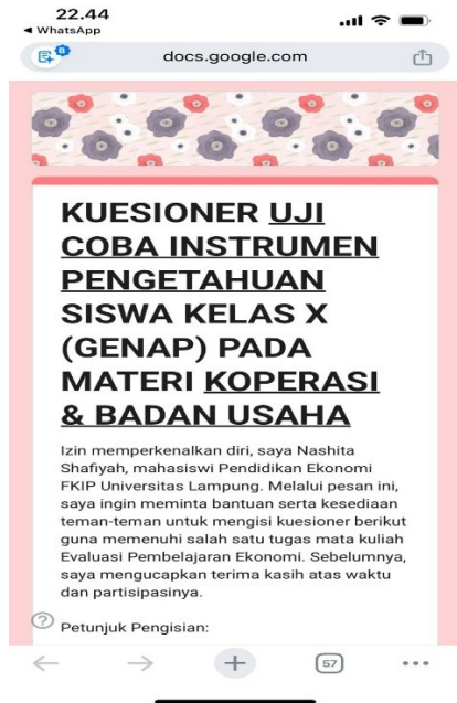
Lampiran 1: Aspek pengetahuan