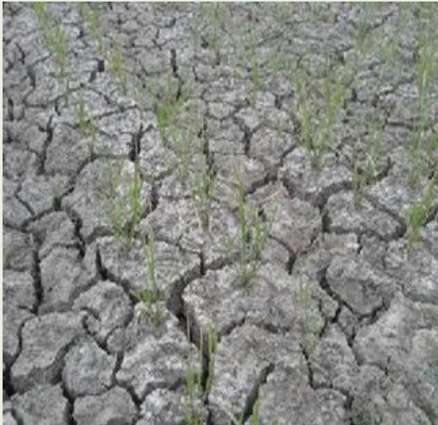
Tanaman padi gogo yang kekeringan