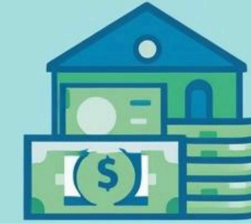
Mortgage doing add-a pending income