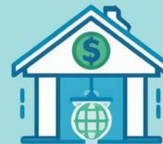
Fee-based income not based on interest rates