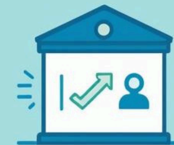
The structure pay to an institution at the renewed income.