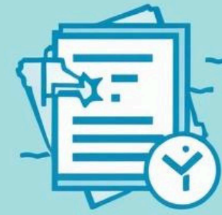
Money banks (financial prerequisites)

Fee-Based Income adalah pendapatan non-bunga yang dihasilkan dari layanan perbankan, seperti transfer antar bank, kartu kredit, dan bancassurance, memberikan keuntungan stabil tanpa ketergantungan pada suku bunga.