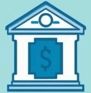
Fee Structure to regulate conditions