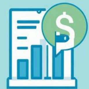
Fee-based income that fee based income