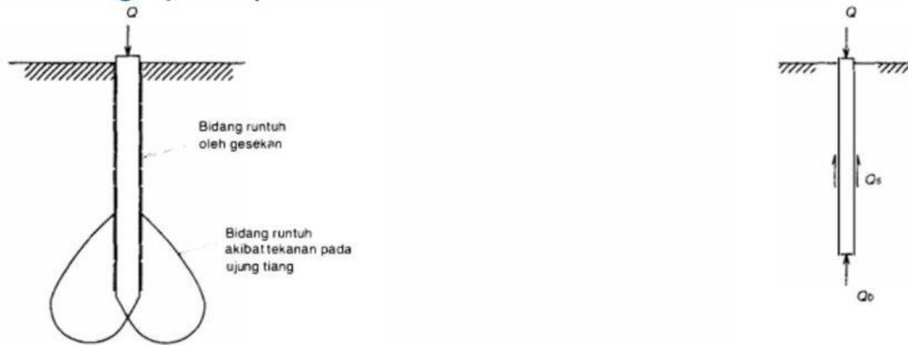
(a) Bidang runtuh pada tiang tekan

Kapasitas dukung ultimit tiang cara statis dihitung dengan menggunakan teori-teori mekanika tanah. Skema bidang runtuh untuk tiang yang mengalami pembebanan tekan dan yang menahan beban dengan mengerahkan tahanan ujung dan tahanan gesek dindingnya diperlihatkan dalam Gambar 2.17 .