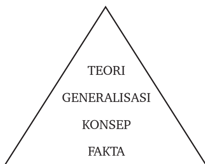
Struktur Ilmu Pengetahuan Sosial